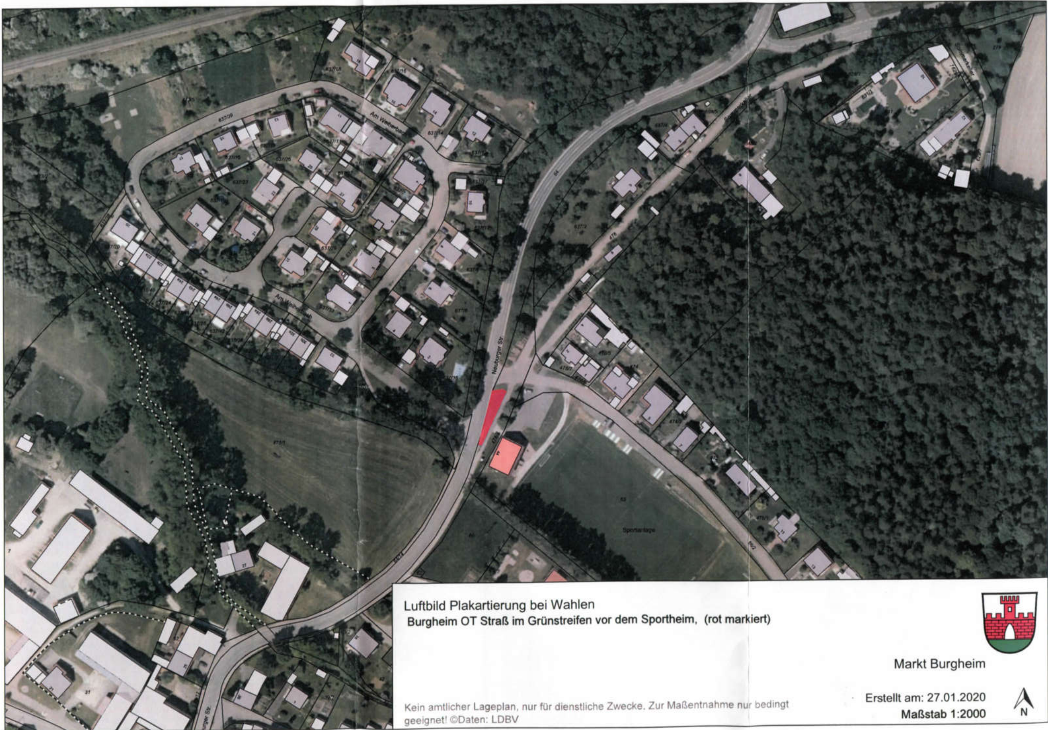
Luftbild Plakartierung bei Wahlen Burgheim OT Straß im Grünstreifen vor dem Sportheim, (rot markiert)

Kein amtlicher Lageplan, nur für dienstliche Zwecke. Zur Maßentnahme nur bedingt geeignet! ©Daten: LDBV